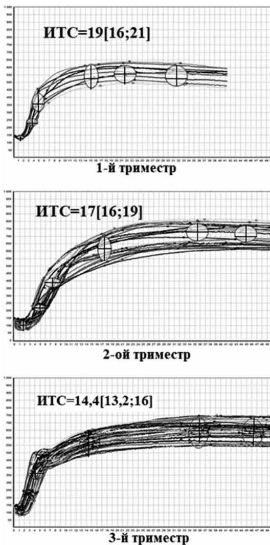
Мал. 1. Базальний фенотип ГП здорових вагітних жінок в залежності від триместру вагітності.

На підставі аналізу базального фенотипу ГП 192-х здорових вагітних жінок, виявлені фізіологічні коливання ГП в залежності від триместру вагітності: в першому триместрі ( n = 53 ) спостерігається структурна і хронометрична гіперкоагуляція, у другому ( n = 68 ) відзначається структурно-хронометрична гіпокоагуляція, в третьому ( n = 71 ) - гіперкоагуляційний зсув на протеолітичному етапі, з хронометричною гіпокоагуляцією на етапах полімеризації і стабілізації згустку (мал. 1).