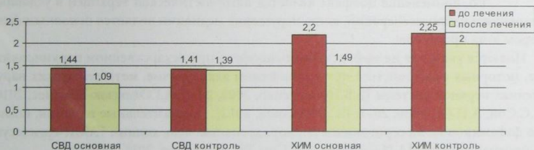
Рис. 2. Средние значения ТИ во всех подгруппах до и после лечения

Средние значения ТИ во всех группах снизились в сторону нормализации.